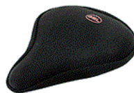
Funda de Gel